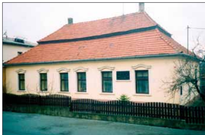
Dům Bedřicha Smetany

nabídnou nejen exponáty, ale především vytvoření digitální databáze historických filmových záběrů s možností dálkového přístupu a prohlížení. Propagace bude zajištěna společným lektákem, webem a panely. Projekt doprovodí společná exkurze, odborná konference, vzdělávací seminář či série slavnostních otevření expozic za doprovodu společně navštívených skladeb dechových hudeb z obou regionů.