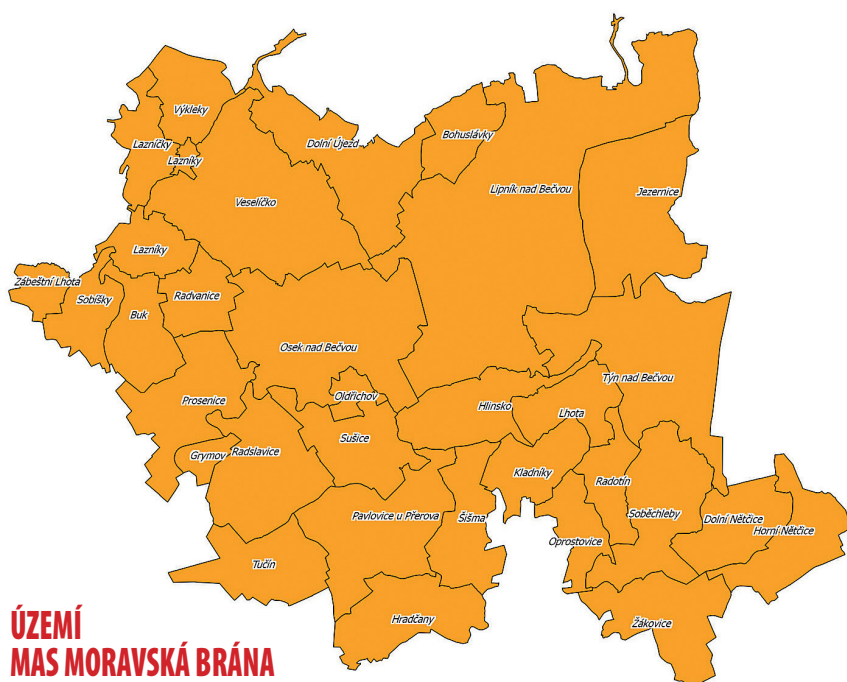
ÚZEMÍ MAS MORAVSKÁ BRÁNA