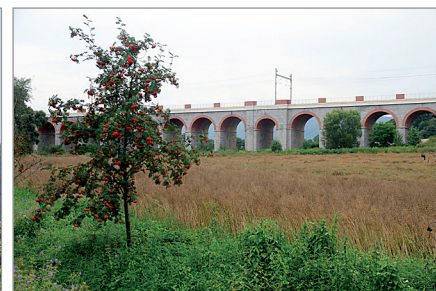
Logo MAS má v sobě obsaženo symboly našich mikroregionů - meandry Bečvy, hrad Helfštýn a viadukt u obce Jezernice.