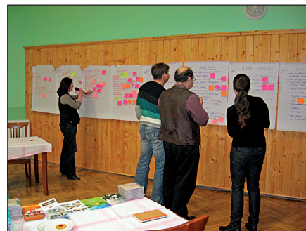
(Veřejné projednávání strategie)