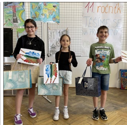
Vítězové 2. kategorie

Po vyhlášení a předání všech cen přišlo na řadu občerstvení a obdivování výtvarných prací. Někteří si fotografovali vítězné obrázky, mnozí se zase fotili se svými vlast-