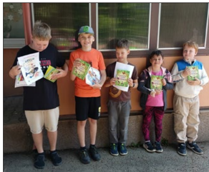
Na 2. místě se umístili žáci ze ZŠ Hranická

Jednotlivá stanoviště si pro soutěžící připravili žáci druhého stupně pod vedením učitelů přírodopisu. Po absolvování všech