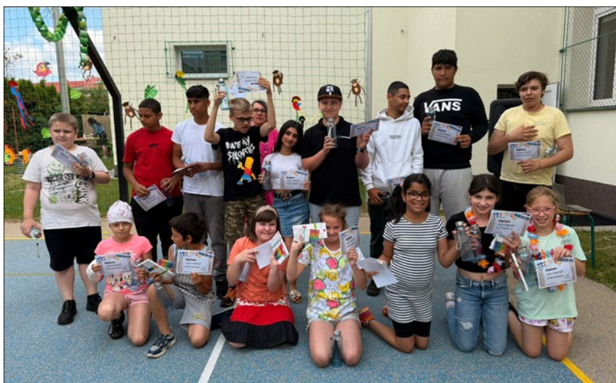
Žáci ze zúčastněných tříd se svými odměnami