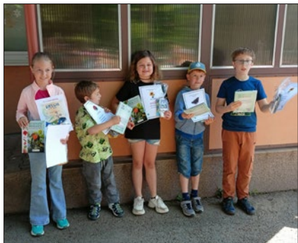
Zvítězilo družstvo ze ZŠ Sluníčko

Soutěž se skládá ze dvou částí – týmové , kde žáci spolupracovali na plnění společných úkolů, a soutěže jednotlivců , ve které soutěžili podle ročníků. Na společných stanovištích žáci poznávali rostliny a živočichy podle jejich přirozeného prostředí – v lese, na louce, na poli i v okolí lidských obydlí. Dobrá spolupráce soutěžících se prokázala zejména při plnění posledního úkolu – vylustění tajenky a splnění úkolu,