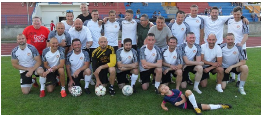
Hostující hráči, kteří v letech 2000–2005 reprezentovali Lipník n. B. v divizní soutěži.