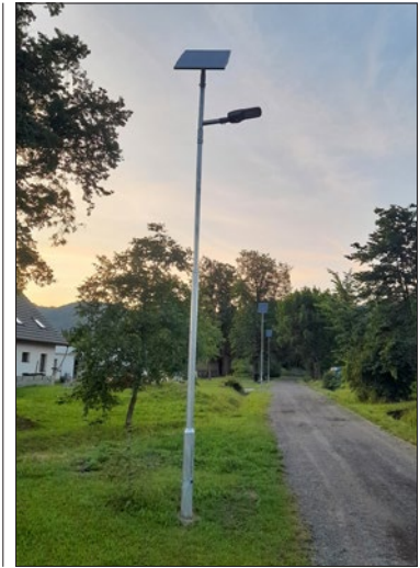
Ilustrační fotografie stejného typu úsporného osvětlení s pohybovým senzorem v Loučce