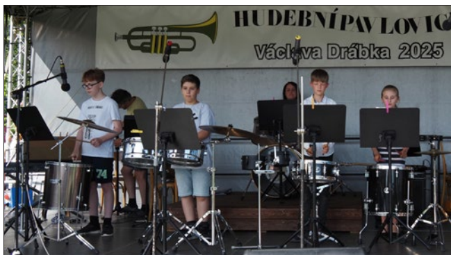
Bubenický soubor „Crazy Drums“ rozparádl obecnstvo