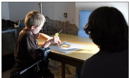
Animátorský workshop s Legem

Oba večery jako tradičně doplnily koncerty kapel – v pátek to byli Nevermore &